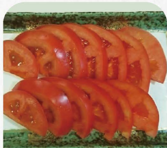
トマトスライス 300円