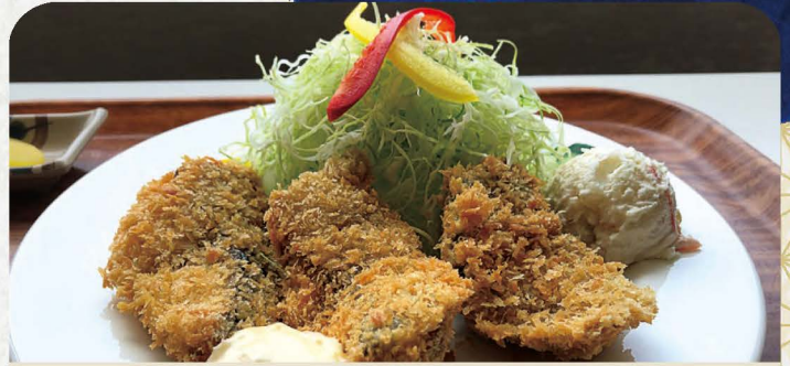
アジフライ定食 870円