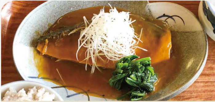
サバの味噌煮定食 900円