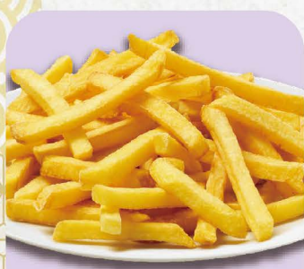
フライドポテト 390円