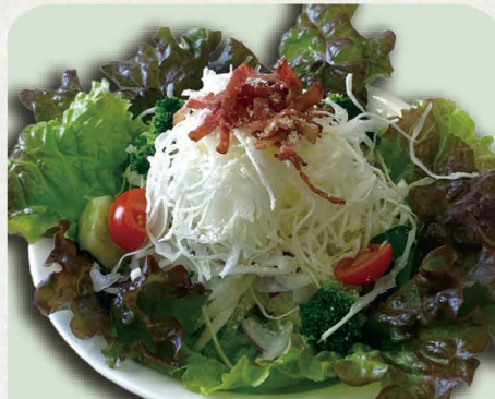
グリーンサラダ 580円