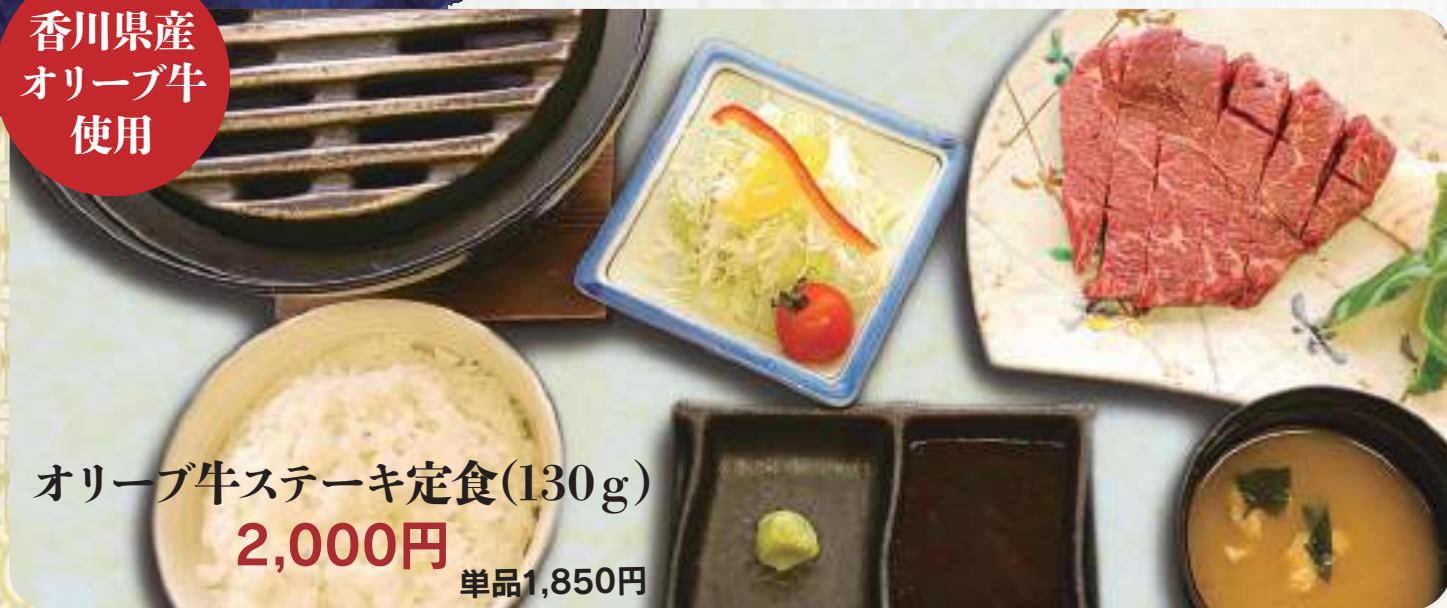
オリーブ牛ステーキ定食(130g) 2,000円 単品1,850円