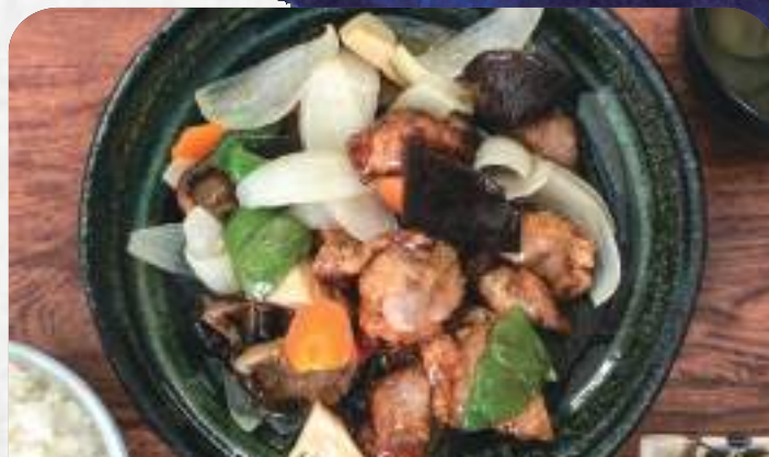
豚肉の黒酢あんかけ定食 1,080円 単品930円