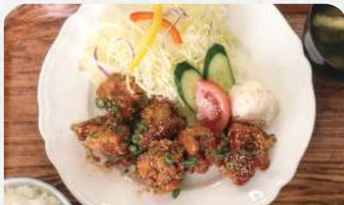
甘辛だれの唐揚げ定食 880円 単品730円