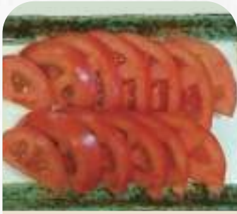
トマトスライス 300円