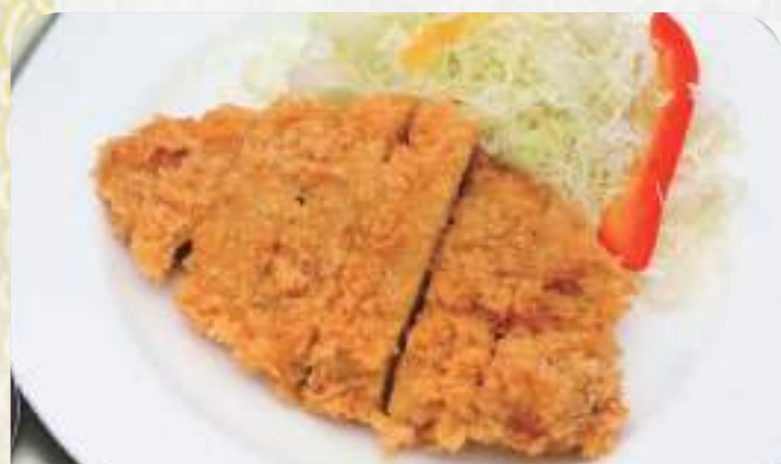
ロースカツ定食 (150g) 980円 単品830円