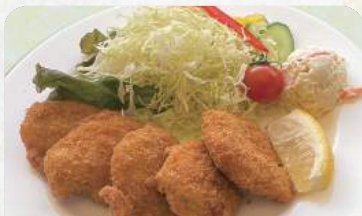
ヒレカツ定食 980円 単品830円