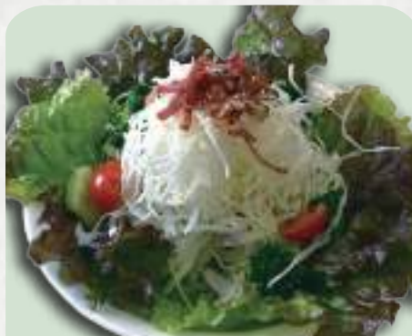
グリーンサラダ 580円