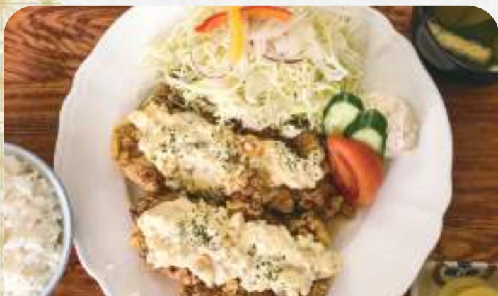
チキン南蛮定食 900円 単品750円