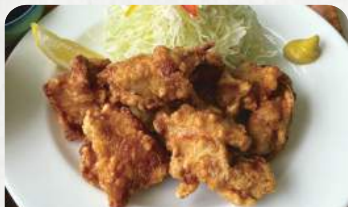
唐揚げ定食 6個 880円 単品730円