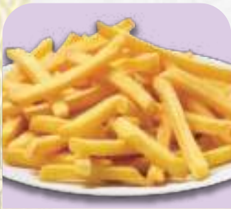
フライドポテト 390円