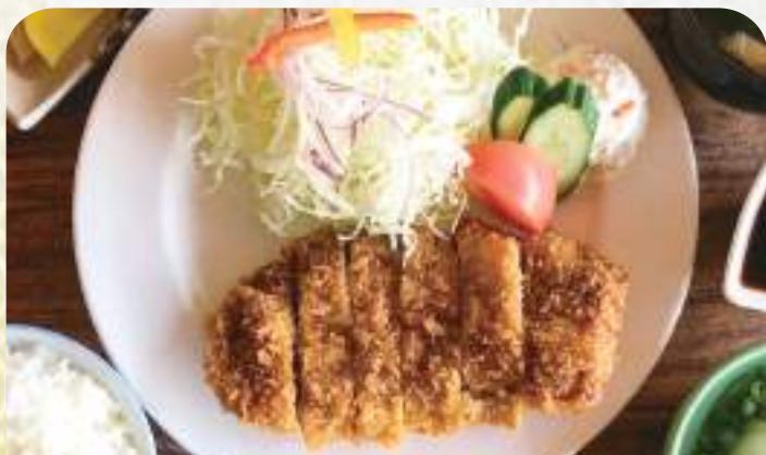
おろしトンカツ定食 1,080円 単品930円