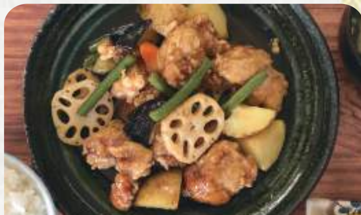
鳥と野菜の黒酢あんかけ定食 980円 単品830円