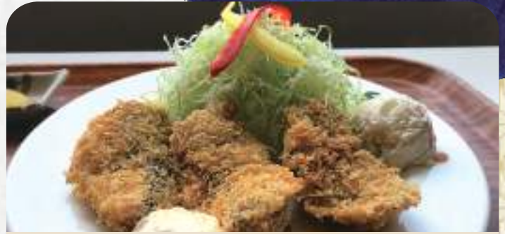
アジフライ定食 870円