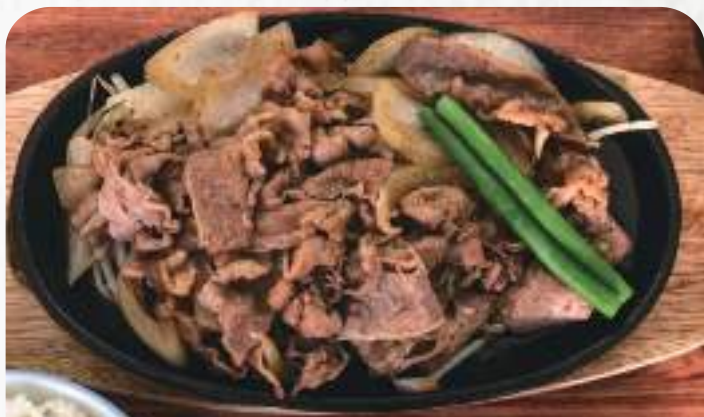
焼肉定食 1,200円 単品1,050円