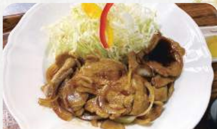
しょうが焼き定食 870円 単品720円