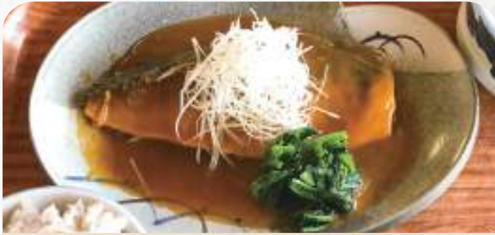
サバの味噌煮定食 900円